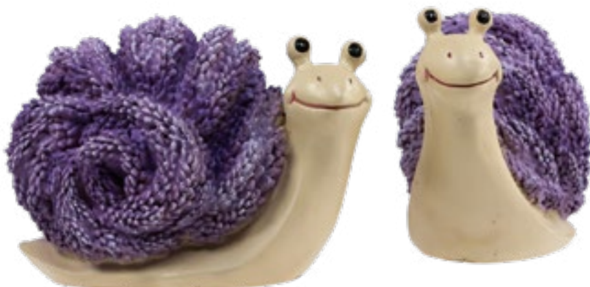
Dekofiguren Art.-Nr.: 830500

Und er weckt die Sehnsucht nach dem Mittelmeer. Denn selbst, wenn er direkt aus dem Vorgarten kommt, bleibt er immer ein echter Provenzale!