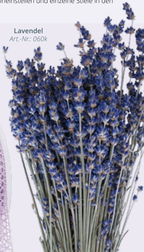
Lavendel Art.-Nr.: 060k