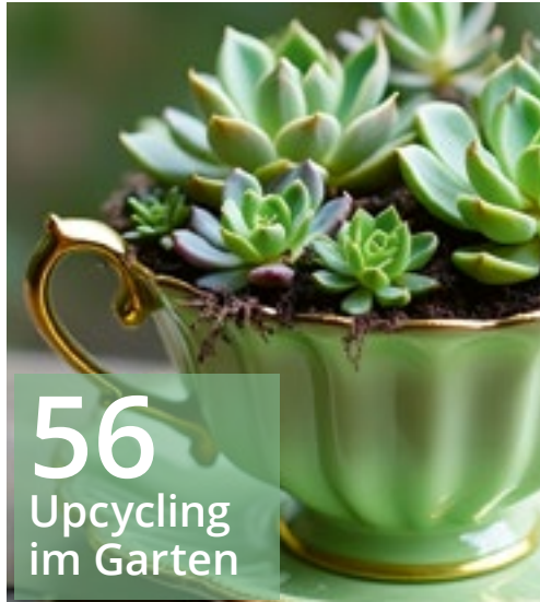
56 Upcycling im Garten