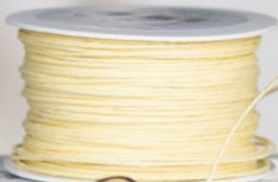
Papierkordel Art.-Nr.: 1932-05