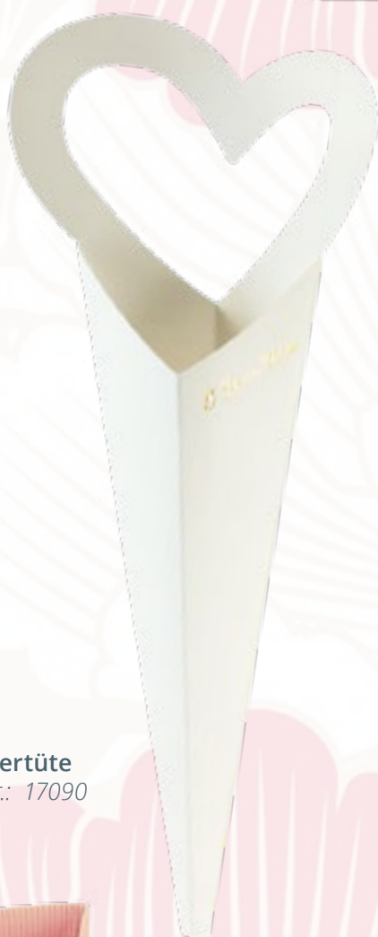
Papiertüte Art.-Nr.: 17090