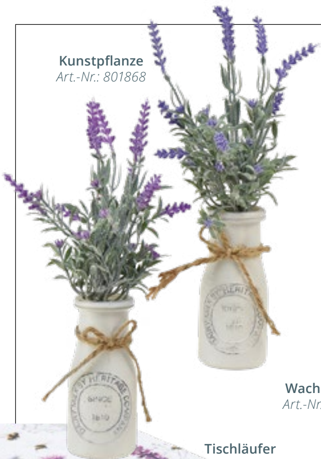
Kunstpflanze Art.-Nr.: 801868