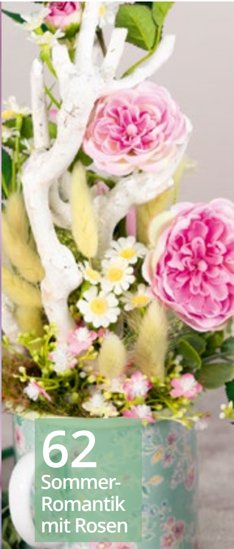
62 Sommer-Romantik mit Rosen