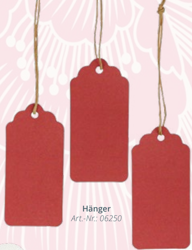
Hänger Art.-Nr.: 06250