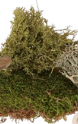
Moos Art.-Nr.: 36029