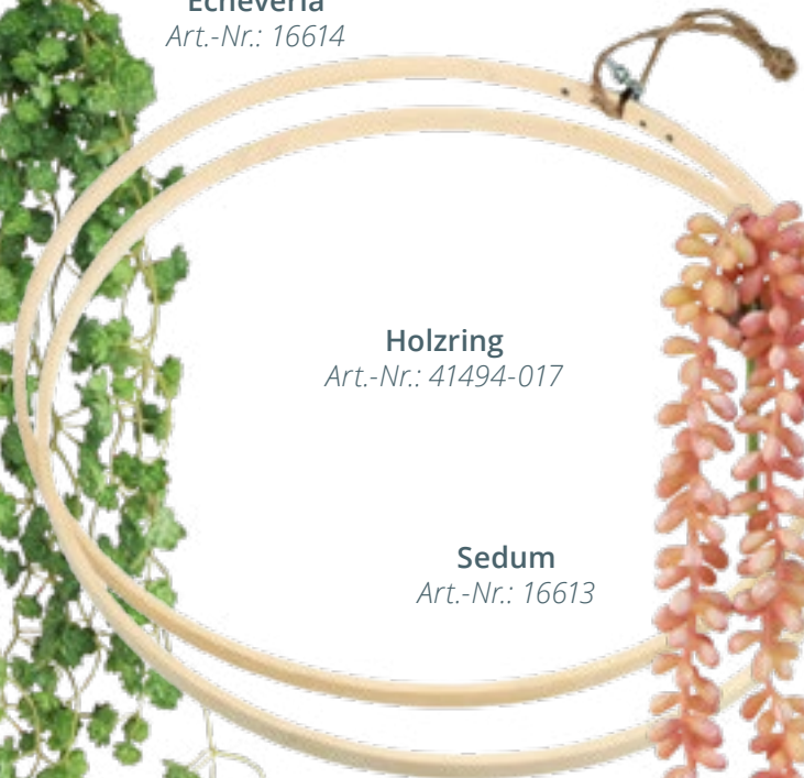
Sedum Art.-Nr.: 16613