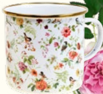
Tasse Art.-Nr.: 03578