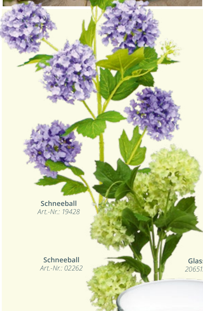
Schneeball Art.-Nr.: 19428