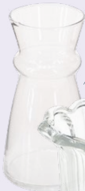
Glasvase Art.-Nr.: 42120