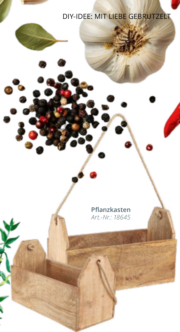
Pflanzkasten Art.-Nr.: 18645