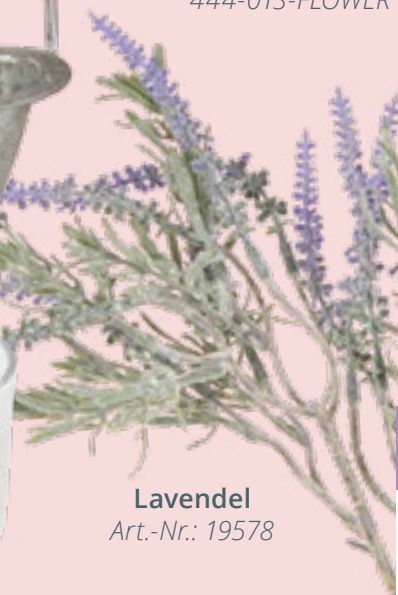
Lavendel Art.-Nr.: 19578