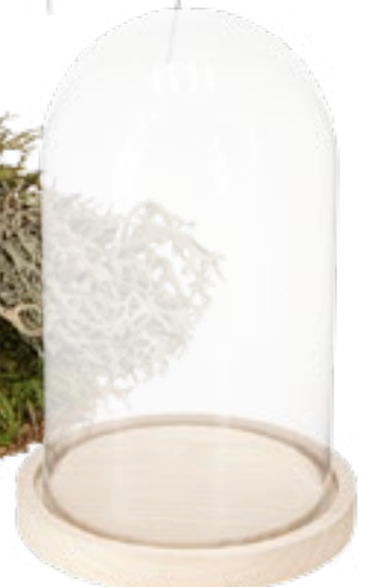
Glasglocke Art.-Nr.: N15/25