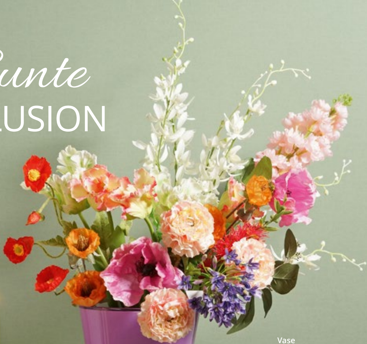
Vase Art.-Nr.: 982713P

Wie gemalt wirkt dieser Strauß aus Garten- und Wiesenblumen. Der Klatschmohn verrät die Kunstpflanzen.