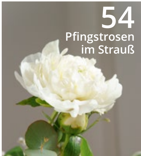
54 Pfingstrosen im Strauß