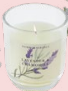
Duftkerze Art.-Nr.: 880245