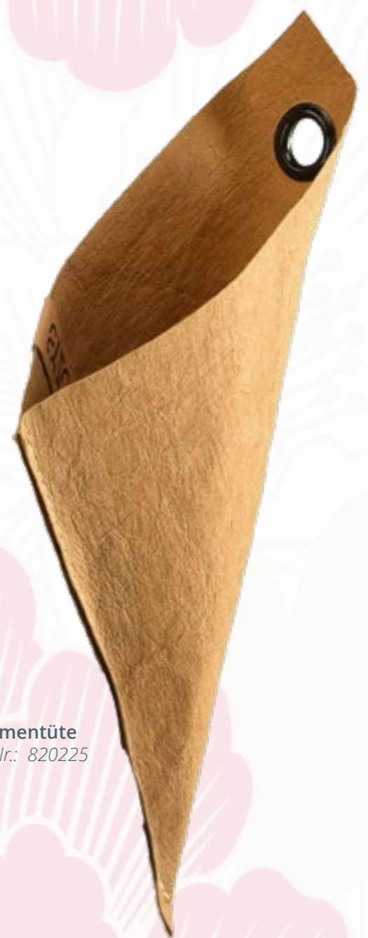
Blumentüte Art.-Nr.: 820225