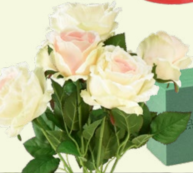
Rosen Art.-Nr.: 15757