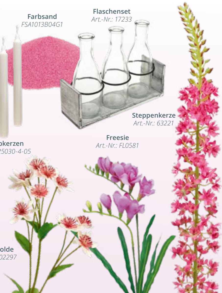
Sterndolde Art.-Nr.: 02297