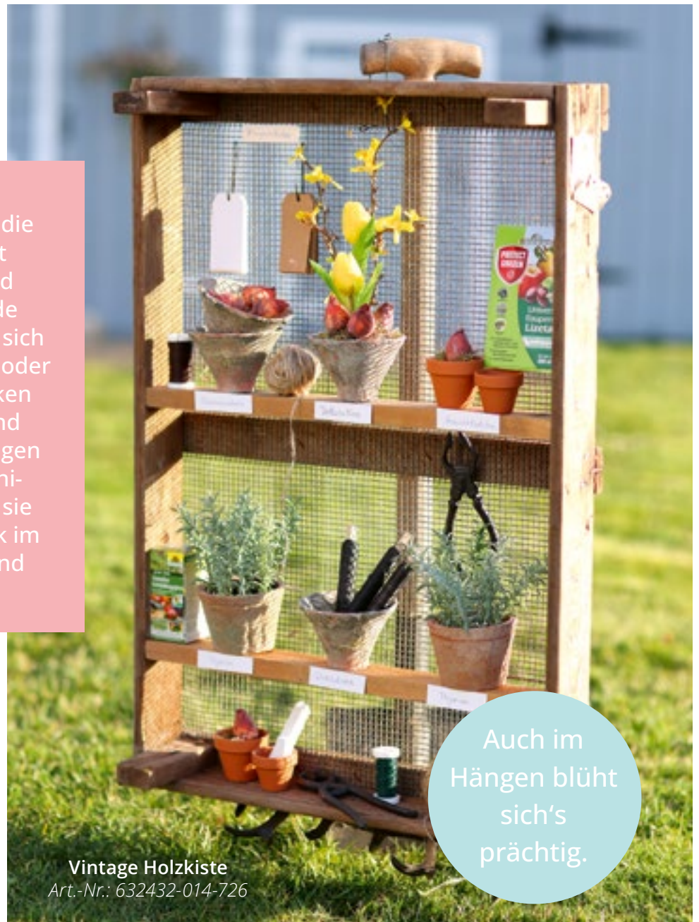
Vintage Holzboxe Art.-Nr.: 632432-014-726

Holzboxen und Emaille sind die Klassiker beim Upcycling mit Pflanzen. Boxen, Kannen und Töpfe sind definitiv zu schade zum Wegwerfen und bieten sich als Pflanzkästen, Übertöpfe oder Blumenampeln an. Die antiken Teile dürfen gerne rosten und Spuren der Verwitterung zeigen – schließlich haben sie so einiges erlebt. Alternativ lassen sie sich mit geeignetem Klarlack im gewünschten Vintage-Zustand konservieren.