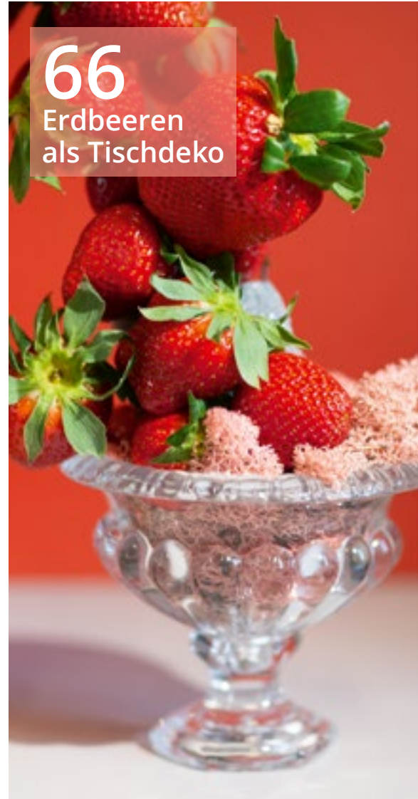
66 Erdbeeren als Tischdeko