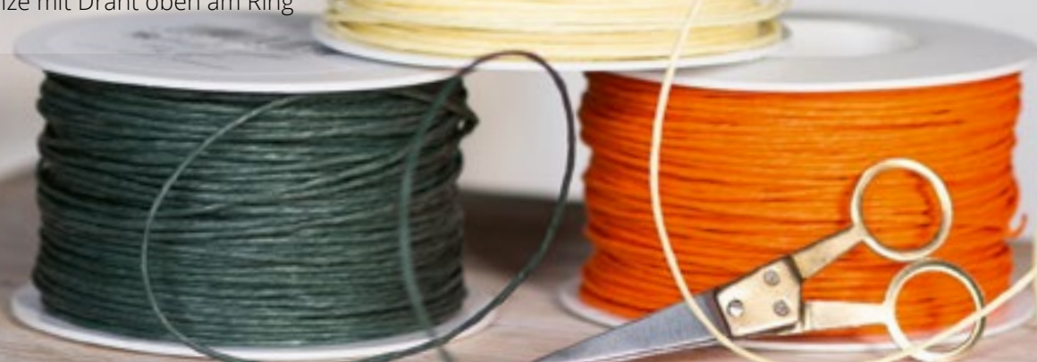
Papierkordel Art.-Nr.: 1932-10