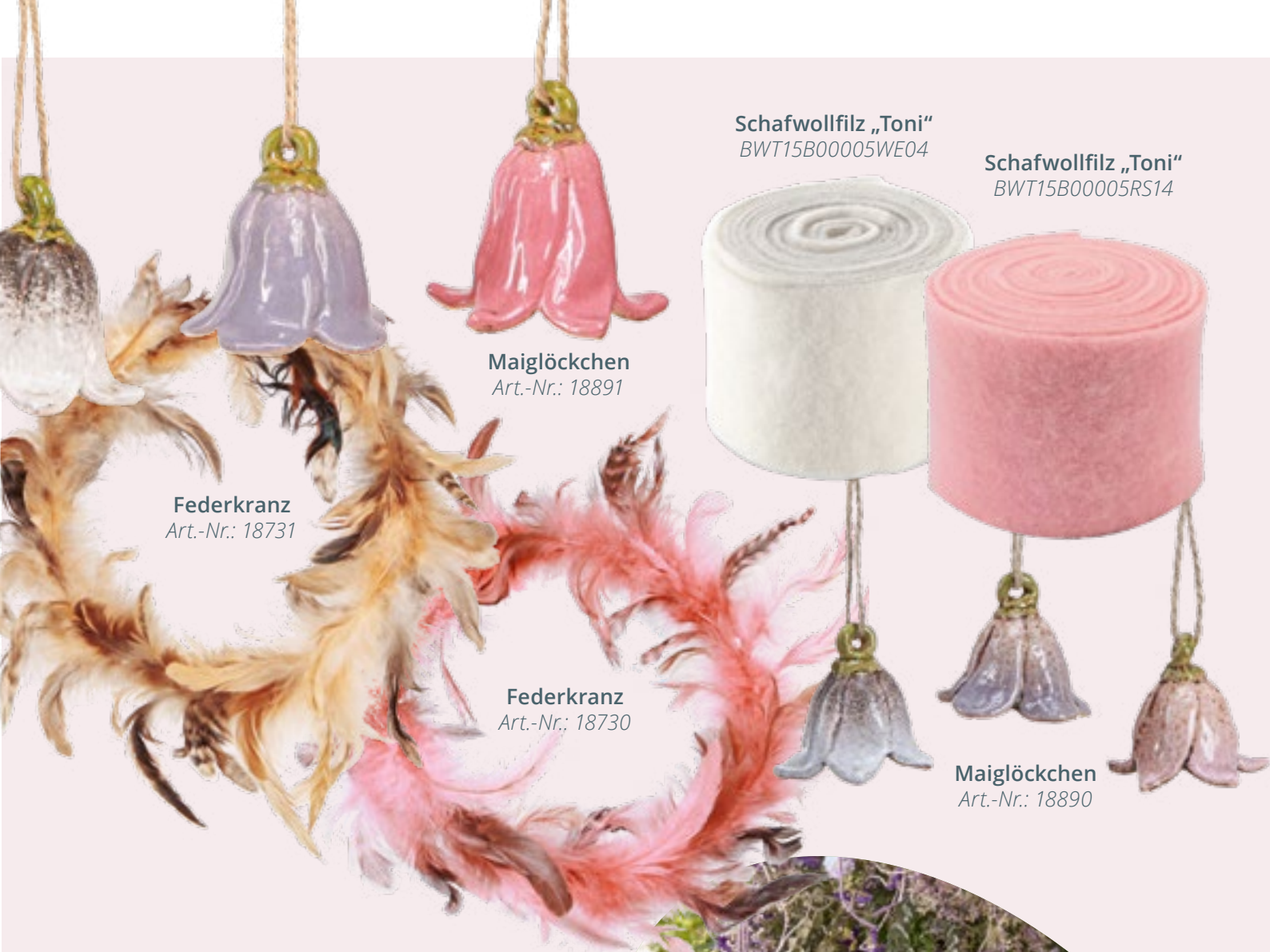
Federkranz Art.-Nr.: 18731