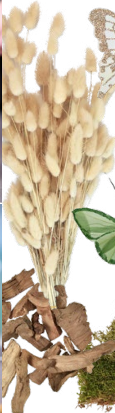
Treibholz Art.-Nr.: 88096