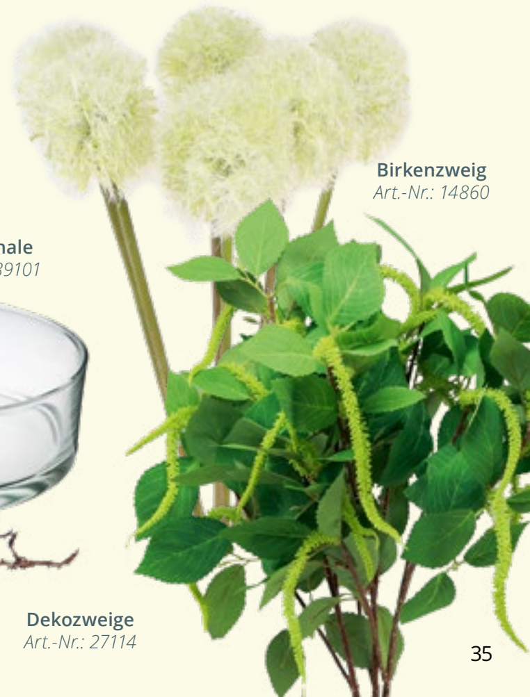
Birkenzweig Art.-Nr.: 14860