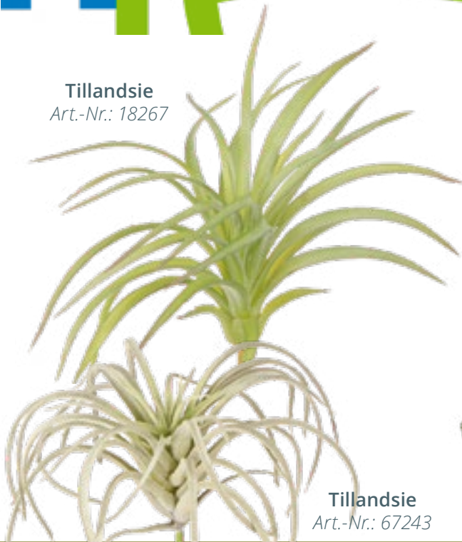
Tillandsie Art.-Nr.: 67243