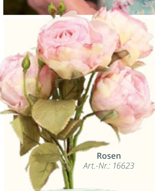
Rosen Art.-Nr.: 16623