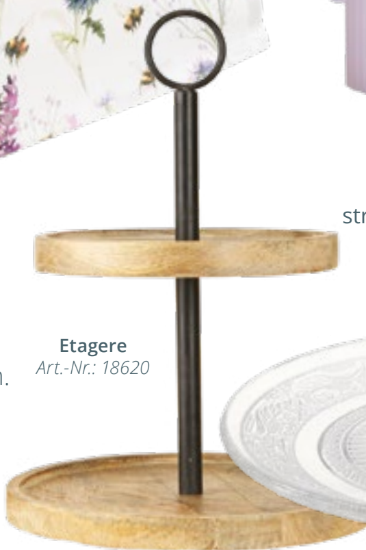
Etagere Art.-Nr.: 18620

LAVENDELFARBEN Passend gefärbte Rillenkerzen strahlen Eleganz aus, verleihen dem Tisch einen festlichen Schein und sind essenziell für das stimmige Farbschema.