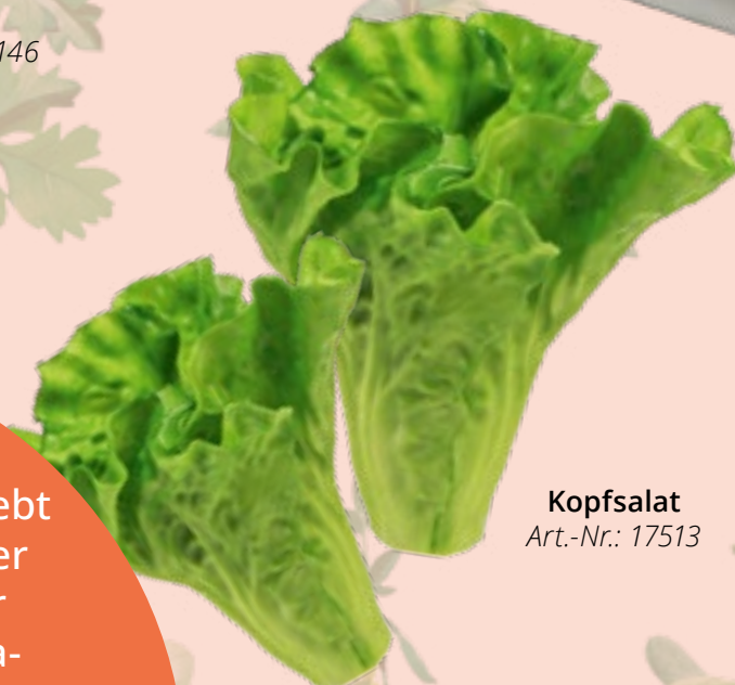
Kopfsalat Art.-Nr.: 17513