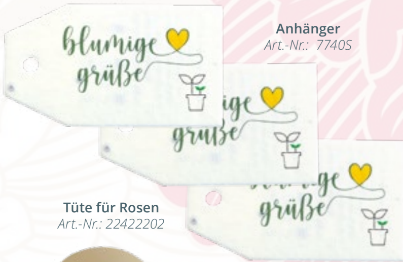
Anhänger Art.-Nr.: 77405