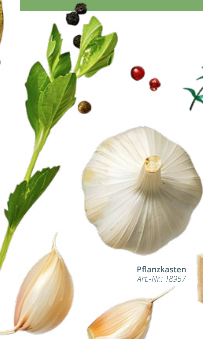
Pflanzkasten Art.-Nr.: 18957