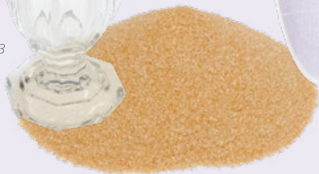
Glasvase Art.-Nr.: H76/23